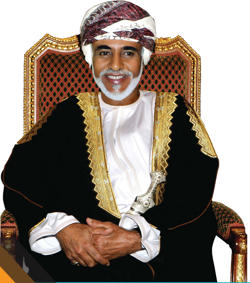
حضرة صاحب الجلالة السلطان قابوس بن سعيد المعظم حفظه الله ورعاه